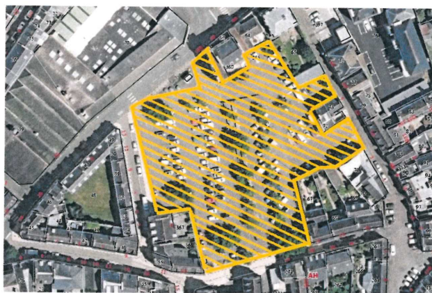
Plan n° 2

Suivant les besoins de l'organisation, le stationnement des véhicules de toutes catégories sera interdit car considéré comme gênant les zones matérialisées en jaune sur le plan n° 1.