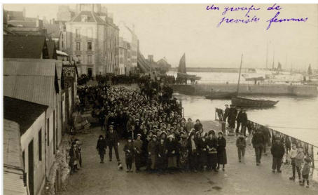
Grève des sardinières 1924 - Un groupe de grévistes femmes