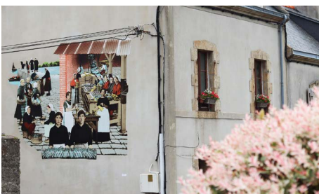
Parcours des fresques de Marianne Larvol