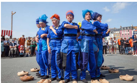
Spectacle BANKADOÛ, 13 femmes en sabots