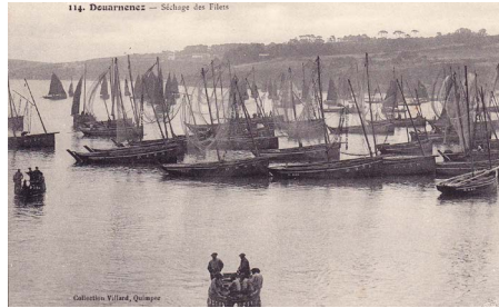
Séchage des filets