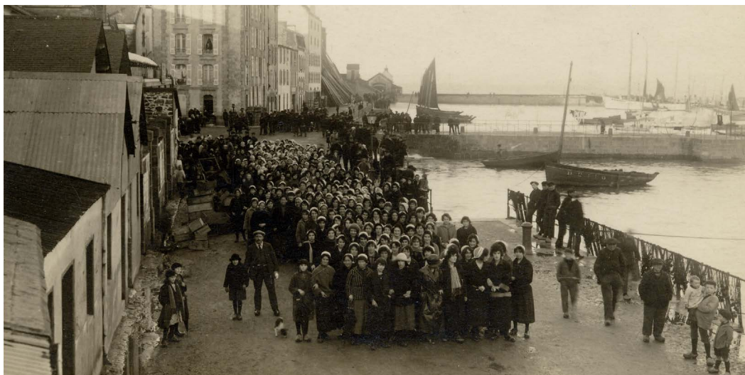
Grève des sardinières 1924 - Un groupe de grévistes femmes