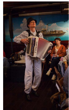
Spectacle La grève rouge de Sabine Corre © Erwan Larzul