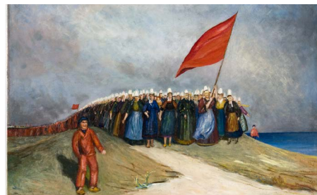
Exposition « La révolte des sardinières » Tableau de Charles Tillon - huile sur toile 1926 Collection Musée de Bretagne