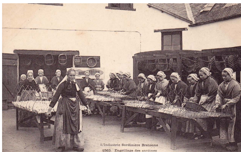
Engrillage des sardines

Bien qu'entraînant une demande accrue de conserves, la Première Guerre mondiale n'a pas éteint les tensions sociales. En 1924, Douarnenez est à nouveau secouée par une grève majeure.