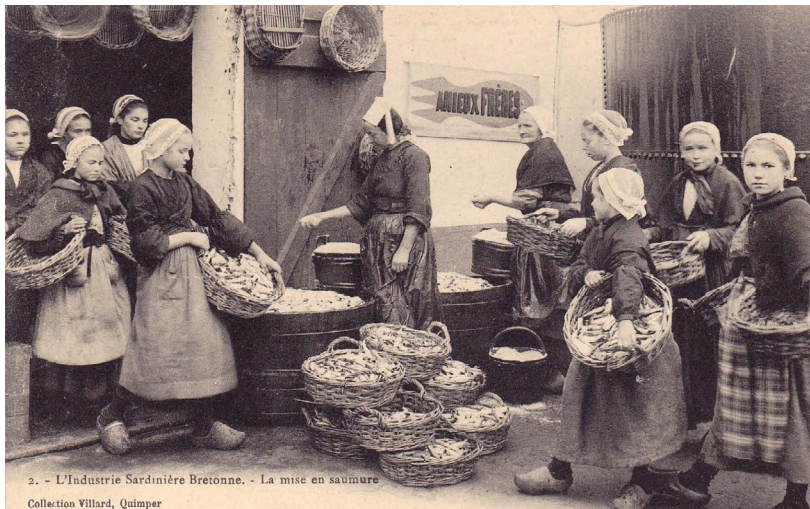
La mise en saumure

Les sardinières ont aussi démontré une remarquable capacité à s'organiser et à revendiquer des améliorations dans des conditions extrêmement difficiles. Enfin, la grève a eu un impact significatif sur le développement des mouvements syndicaux en Bretagne et en France. Elle a souligné la force des syndicats et a contribué à des réformes législatives concernant le travail des femmes et les conditions de l'industrie.