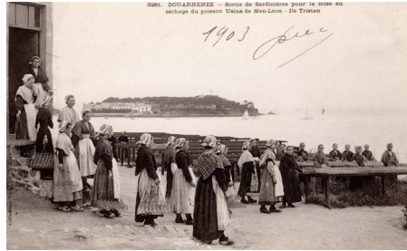
Sortie des sardinières pour la mise au séchage du poisson