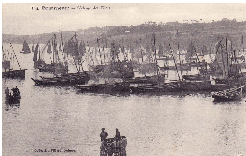
Séchage des filets

Reprise du travail après la fin de la grève.