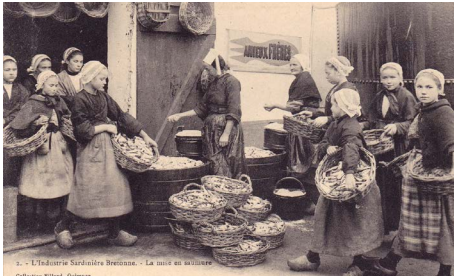
La mise en saumure - Collection Jean-Pierre Barbier