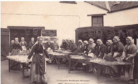
Engrillage des sardines