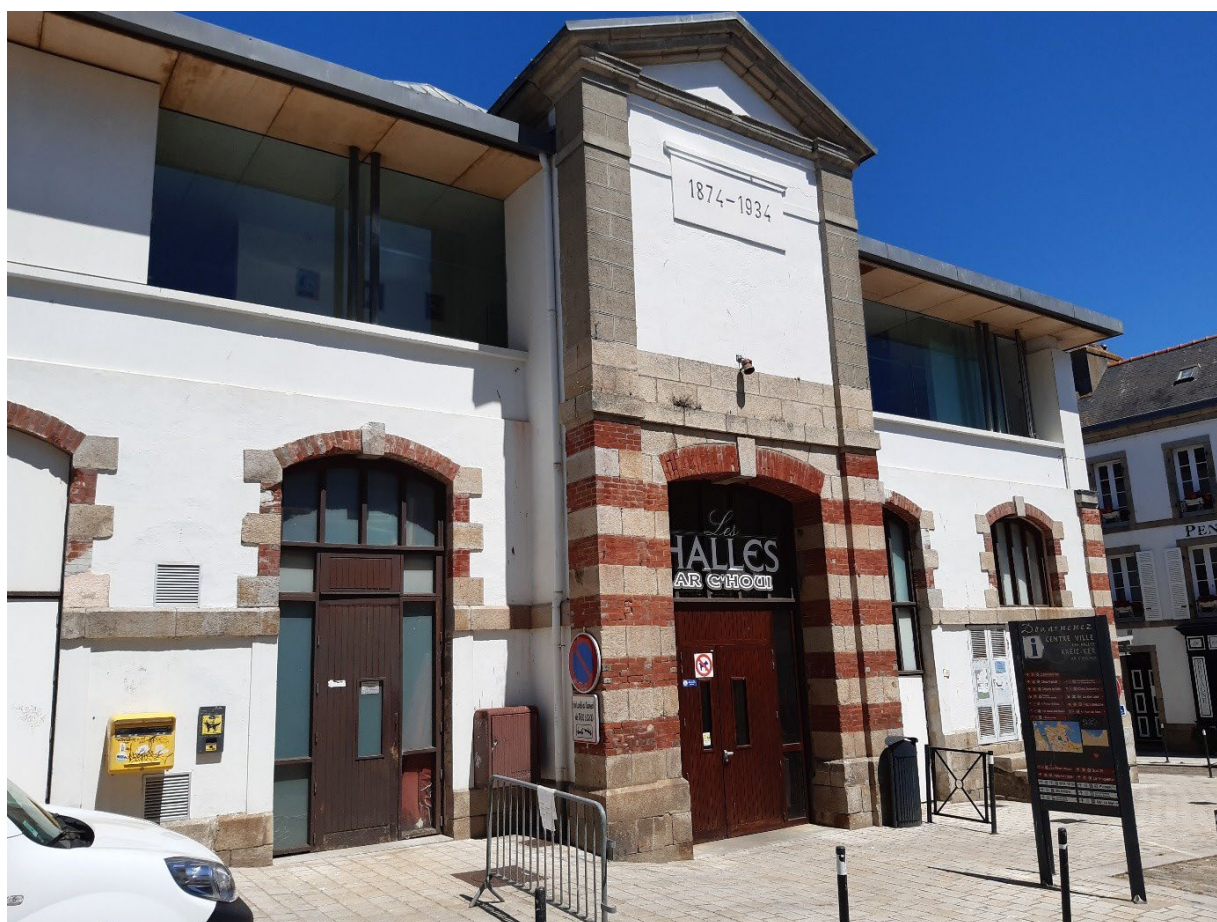
Photo : Entrée des halles de Douarnenez, rue Anatole France