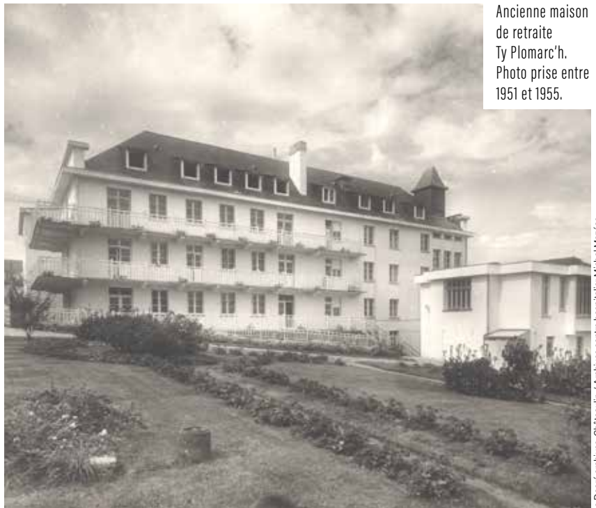
Ancienne maison de retraite Ty Plomarc'h. Photo prise entre 1951 et 1955.

Le site est cédé par le centre hospitalier, propriétaire, par l'intermédiaire de l'Établissement Foncier de Bretagne (EFB) qui assure le portage foncier de l'opération. Il est ainsi fait appel aux groupements de promoteurs intéressés. À l'issue du premier temps de la consultation, trois opérateurs seront invités à présenter une offre. Celui dont l'offre respectera le mieux les attendus de l'appel à projet sera retenu par le jury d'ici la fin 2023. Le chantier pourrait débuter fin 2024.