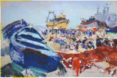
Port d'Essaouira - Les remorqueurs 93 x 67 cm, gouache sur contrecollé.