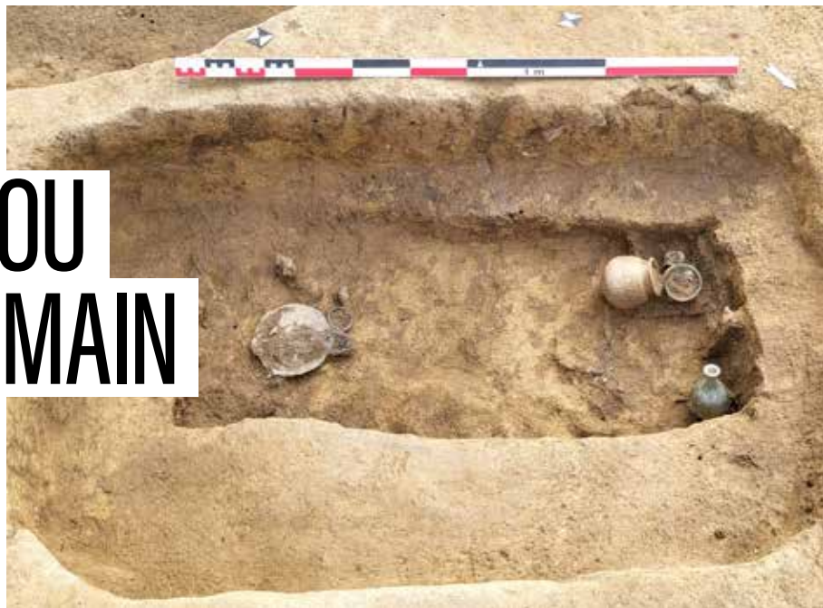
Yoann Dieu, Conseil départemental du Finistère

Ronan Bourgaut, responsable du centre départemental d'archéologie du Finistère ne s'attendait pas à une telle découverte : « Il ne s'agit pas d'une découverte majeure, mais nous ne nous attendions pas à trouver un cimetière à cet endroit. Cette découverte nous permet d'esquisser les limites extérieures d'une hypothétique agglomé-