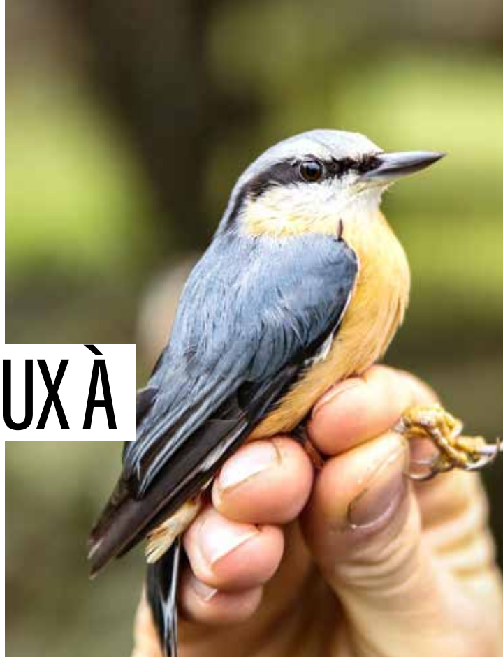
Sittelle torchepot identifiée et baguée aux Plomarc'h début janvier.

Au cours de six matinées, les oiseaux ont été capturés au moyen de filets placés devant des mangeoires. Puis chacun a été identifié, pesé, mesuré, bagué, puis relâché. Environ cent passereaux de dix-huit espèces différentes ont été bagués lors de chaque session, les mésanges bleues et les verdiers d'Europe étant les plus représentés. Les agents municipaux en charge de la valorisation des sites naturels ont pu, à cette occasion, se former à la manipulation des oiseaux et approfondir leurs connaissances ornithologiques.